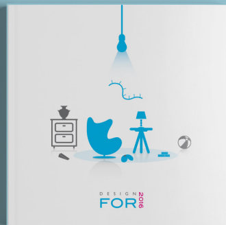
Design For 2016