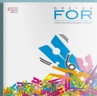
Design For 2012