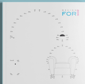
Design For 2015