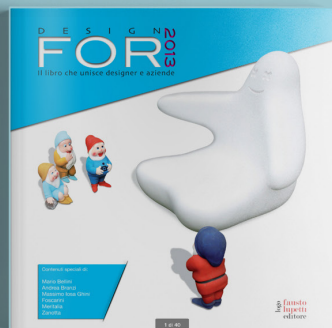
Design For 2013