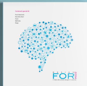
Design For 2014