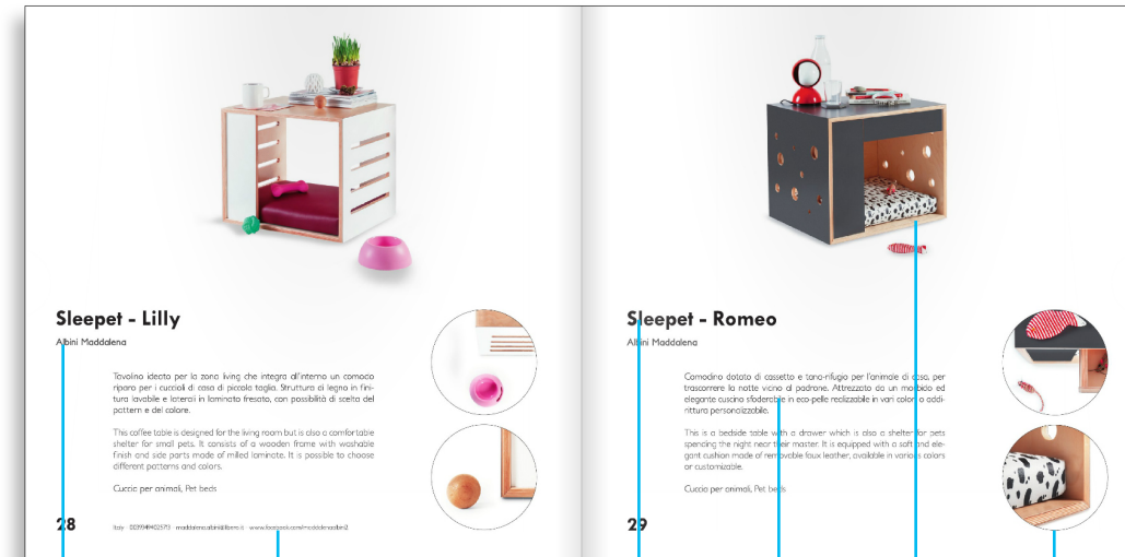
Nome del Designer

Il libro è in versione bilingue per cui tutti i contenuti testuali sono redatti sia in italiano che in inglese. Inoltre i progetti vengono presentati principalmente attraverso foto o rendering di still life, foto di dettaglio e ambientazioni.