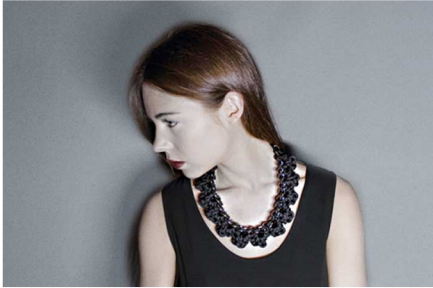
Collana di Alenia